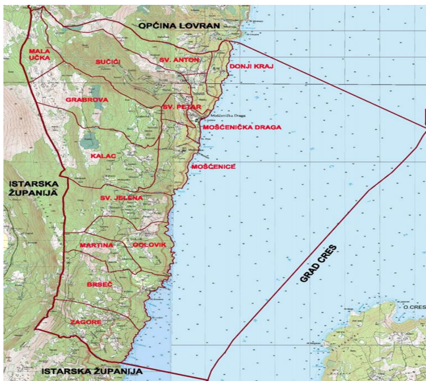
Slika 1: Položaj Općine Mošćenička Draga i granice statističkih naselja unutar nje

Područje Općine Mošćenička Draga obuhvaća 15 statistički samostalnih naselja i to: Brseč, Donji Kraj, Golovik, Grabrova, Kalac, Mala Učka, Martina, Mošćenice, Mošćenička Draga, Obrš, Sučići, Sveta Jelena, Sveti Anton, Sveti Petar i Zagore čiji su položaj i granice prikazane na narednoj slici.